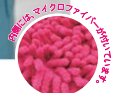
内側には、マイクロファイバーがはいっています。