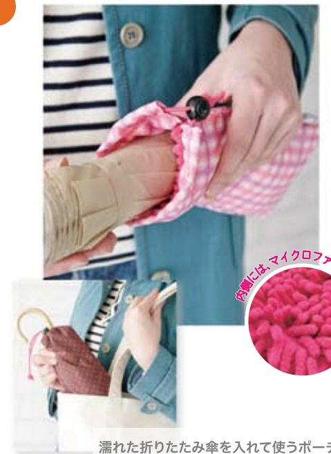
濡れた折りたたみ傘を入れて使うポーチ。 カバンに入れても安心です。