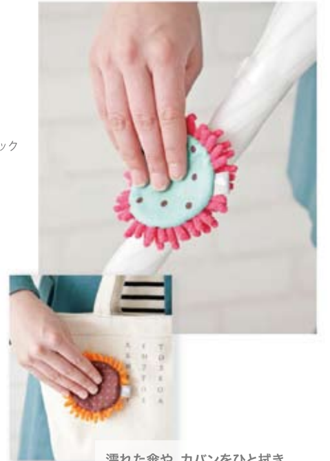
濡れた傘や、カバンをひと拭き。 電車や車に乗るときも、不快にさせません!