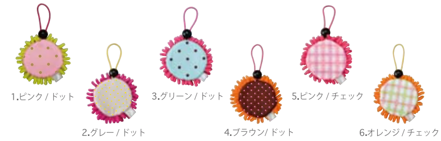
水滴を吸い取る 雨用チャーム