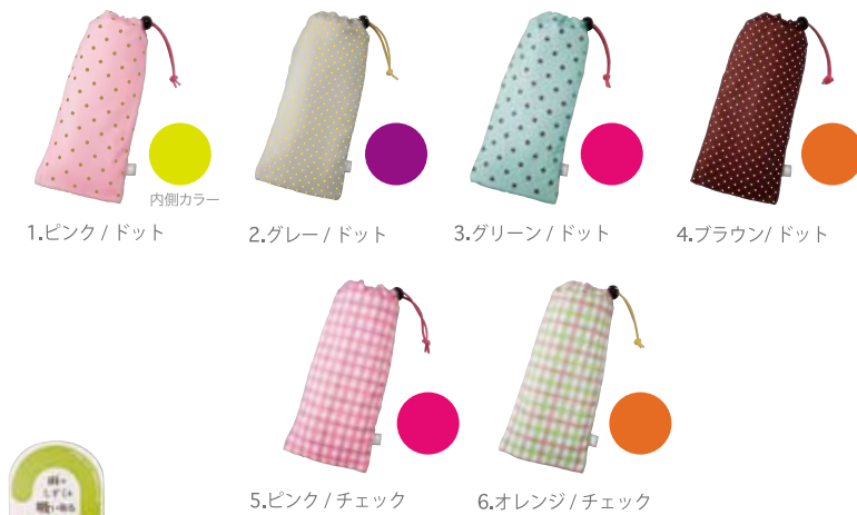
水滴を吸い取る 傘用ポーチ